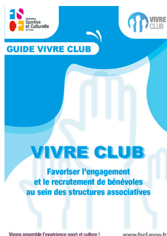
Le guide « Vivre Club »